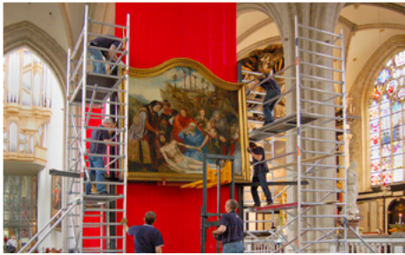
Met grote omzichtigheid wordt een schilderij behandeld in de Onze-Lieve-Vrouwekathedraal in Antwerpen

maakt voor veel geld en na één keer gooien we ze weg. Heb jij een idee?’”