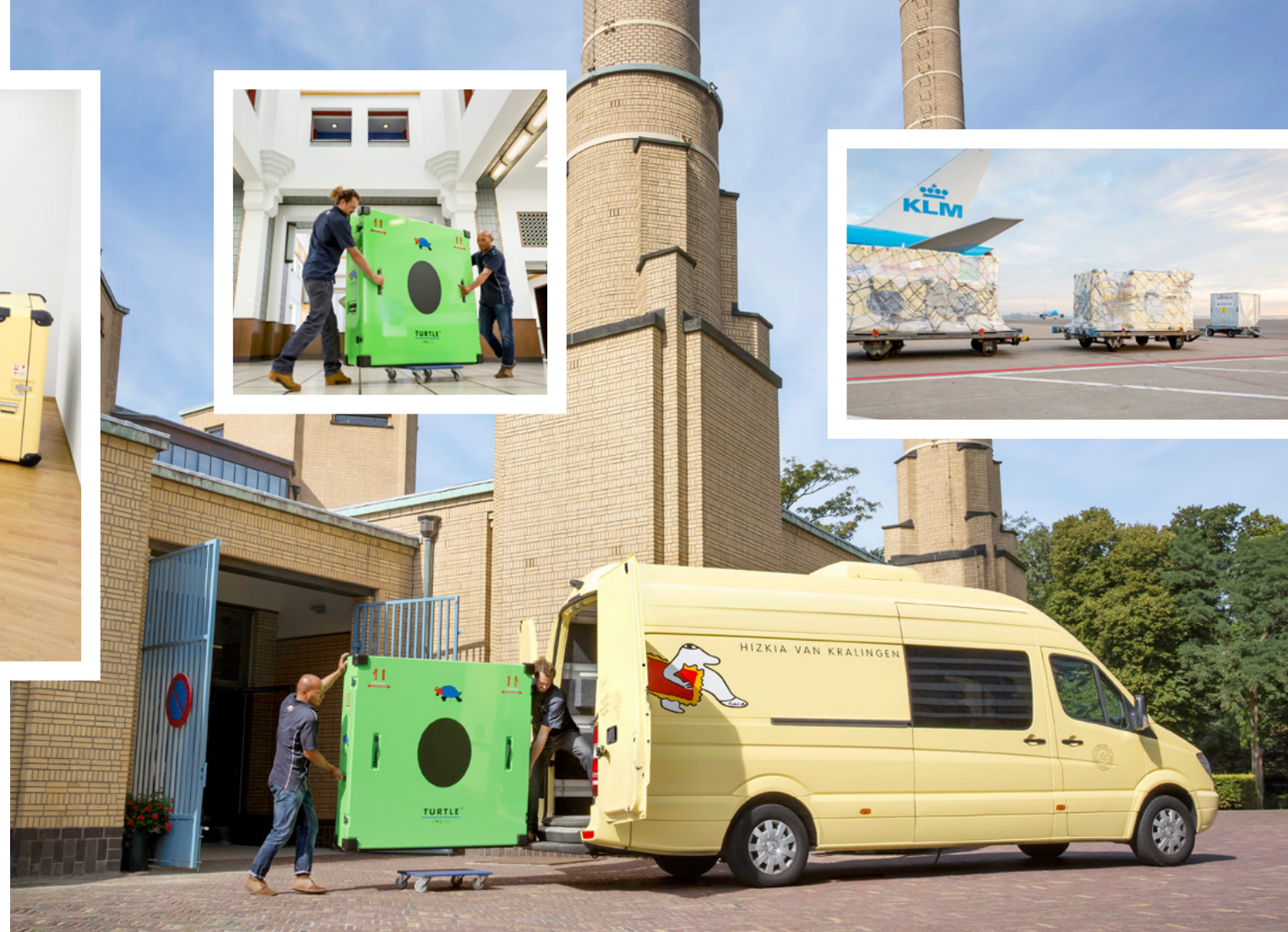
De Turtle met inhoud gaat op reis in een busje van Van Kralingen en dan per vliegtuig verder