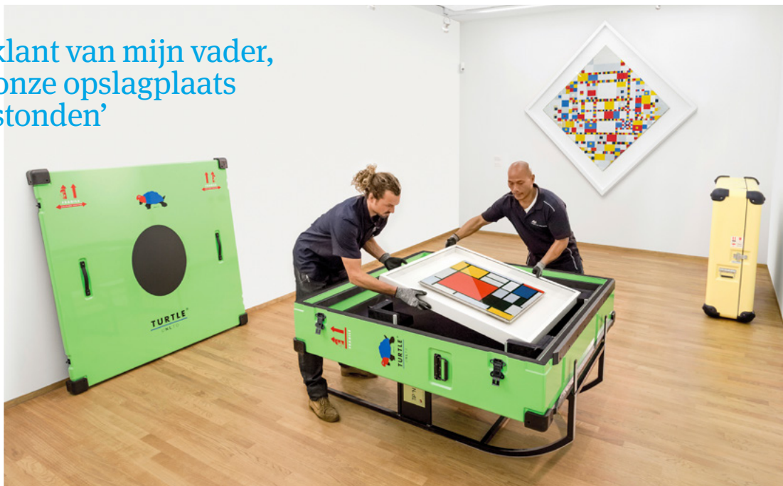
Met grote voorzichtigheid wordt een Mondriaan ingepakt

Daarvoor heeft Van Kralingen overigens zelf al 25 jaar geleden iets bedacht: de Turtle, een kist om kunst probleemloos mee te vervoeren. In het Haagse gebouw staan ze beneden in rijen te wachten om te worden gebruikt. Aan de muren hangt kunst: de deuren van de vrachtwagens zijn op verzoek van de transporteurs beschilderd door kunstenaars. Sommige van die kunstwerken zijn uitgezaagd en