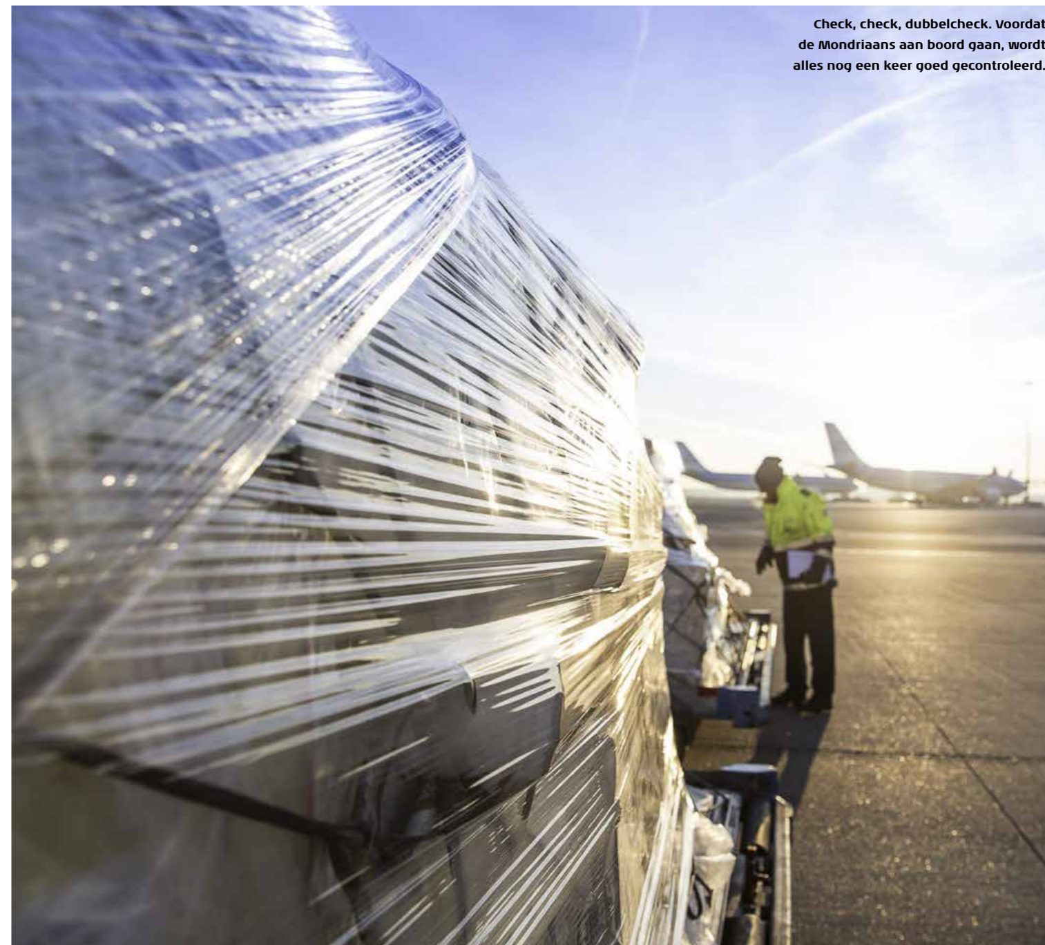
Check, check, dubbelcheck. Voordat de Mondriaans aan boord gaan, wordt alles nog een keer goed gecontroleerd.